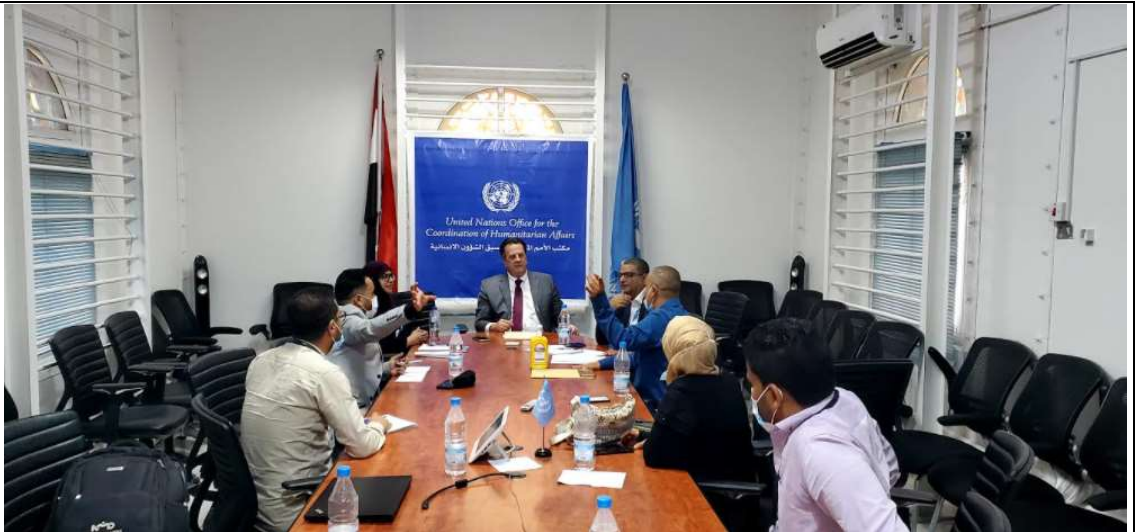
Figure 3 December 14, Presenting the localisation Initiative to OCHA