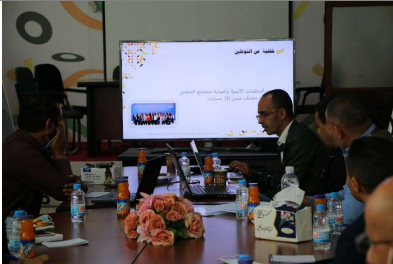
Figure 1 November 10, 2021 Presenting the localisation Initiative to ITAR and discussing baseline planning