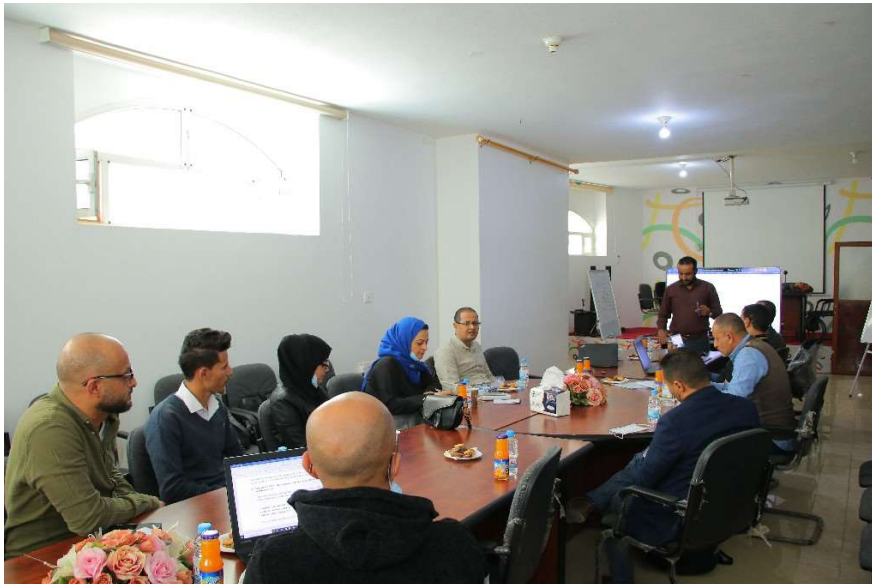
Figure 4 January 9-11, 2022 Localisation Baseline Inception Planning