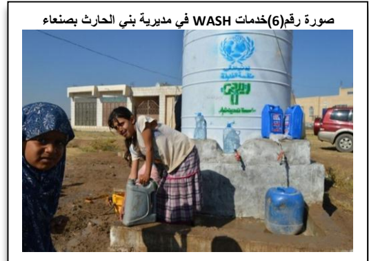
صورة رقم (6) خدمات WASH في مديرية بني الحارث بصنعاء

٥,٢,٢,٣ مشروع المساعدات في مجال المياه والصرف الصحي والنظافة وتوزيع المواد غير الغذائية (NFIs)