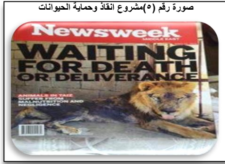
صورة رقم (٥) مشروع انقاذ وحماية الحيوانات

٤,٢,٢,٣ مشروع تزويد النازحين والأسر المتضررة بالمياه الصالحة للشرب في مديريات بني الحارث وشعوب وسنحان وبني بهلول