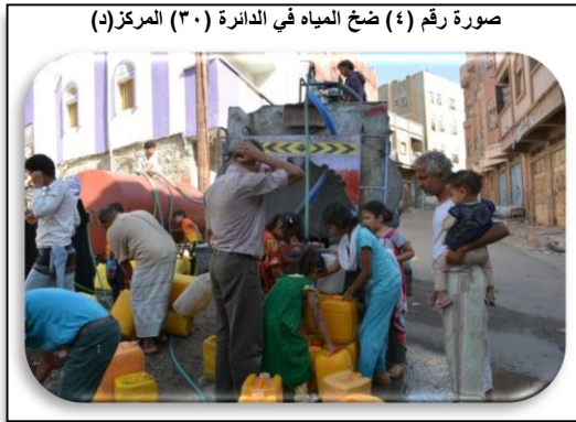
صورة رقم (٤) ضخ المياه في الدائرة (٣٠) المركز(د)

خلال الفترة ٤ نوفمبر ٢٠١٥ - ٩ اكتوبر ٢٠١٦ نفذت المؤسسة مشروع ضخ المياه للدائرة (٣٠) المركز (د) بمديرية المظفر بمدينة تعز، والذي شمل حارات الضرية العليا والسفلى