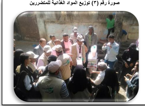
صورة رقم (٣) توزيع المواد الغذائية للمتضررين

هدف المشروع: تقديم العون الغذائي للفئات الاكثر ضعفا من المجتمع المضيف في