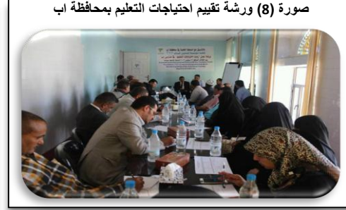
صورة (8) ورشة تقييم احتياجات التعليم بمحافظة اب