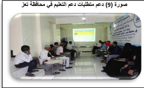
صورة (9) دعم متطلبات دعم التعليم في محافظة تعز