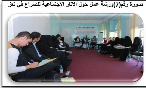
صورة رقم(7)ورشة عمل حول الازثار الاجتماعية للصراع في تعز